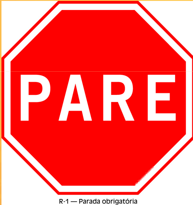
R-1 — Parada obrigatória