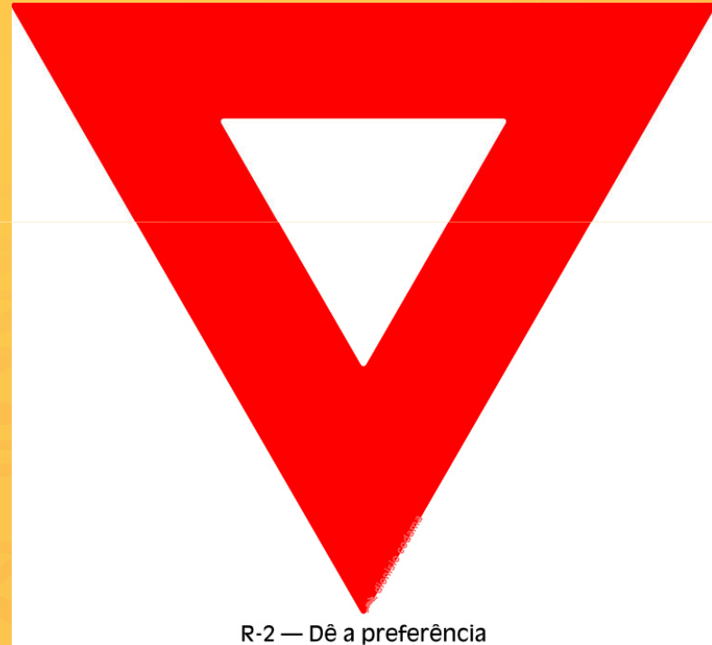
R-2 — Dê a preferência