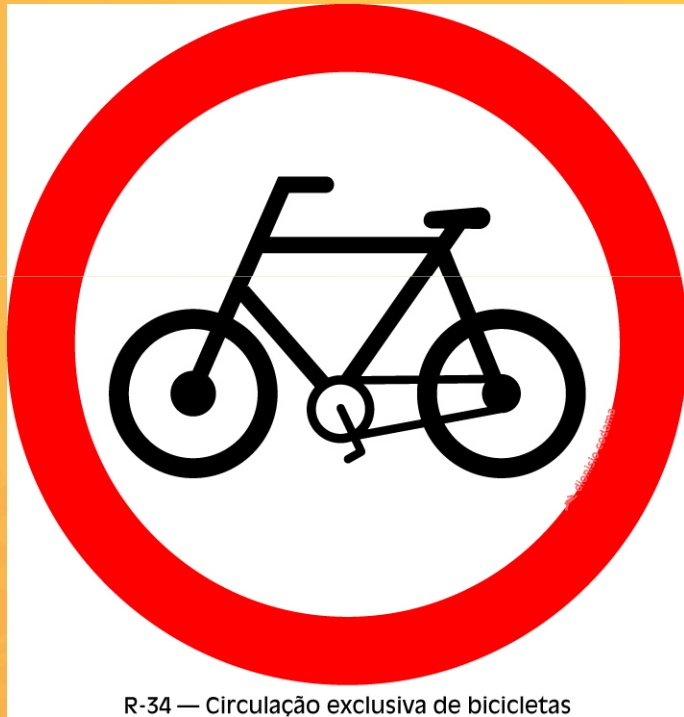
R-34 — Circulação exclusiva de bicicletas