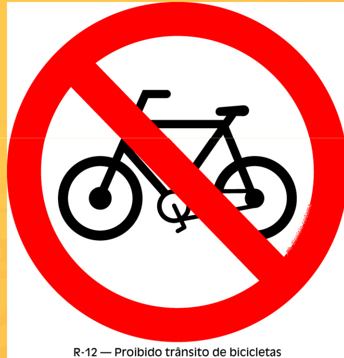
R-12 — Proibido trânsito de bicicletas