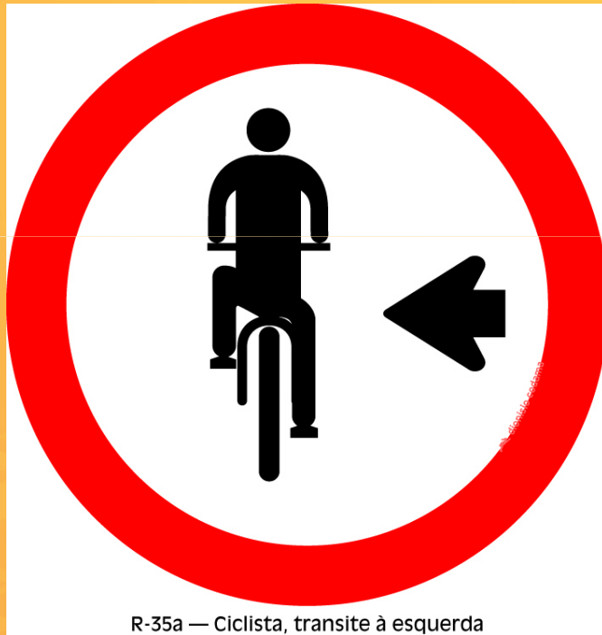
R-35a — Ciclista, transite à esquerda