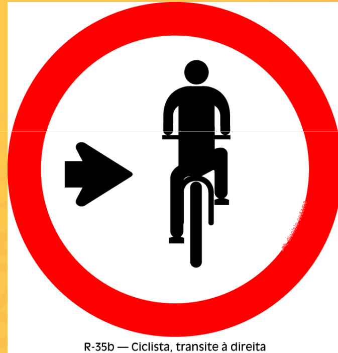
R-35b — Ciclista, transite à direita